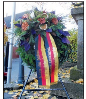
Kranz der KK Selztal e.V.