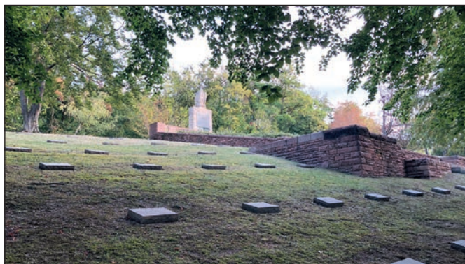
Deutscher Soldatenfriedhof Illfurt im Elsass.