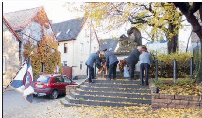
Kranzniederlegung am Denkmal.