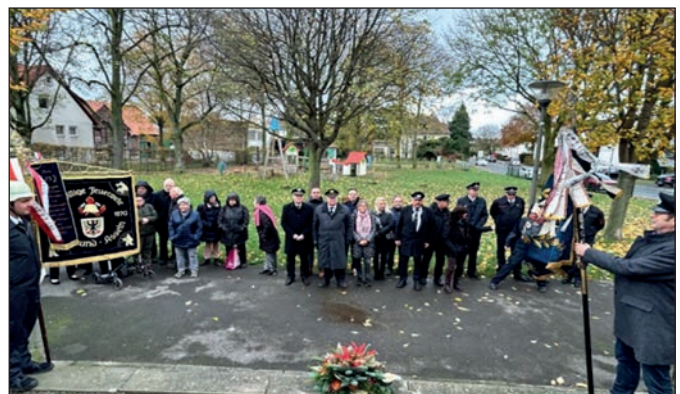
Die Teilnehmenden der Gedenkfeier.

Jahren und gedachte der Opfer der großen Weltkriege und der aktuell tobenden Kriege im Nahen Osten und der Ukraine. Nach der traditionellen „Kranzniederlegung“, begleitet durch den Trompeter mit dem Lied „Der gute Kamerad“ wurden alle Anwesenden (auch Freiwillige Feuer und Asselner Bevölkerung) zum gemeinsamen Gedankenaustausch in die Gaststätte „Zum Bürgerkrug“ eingeladen.