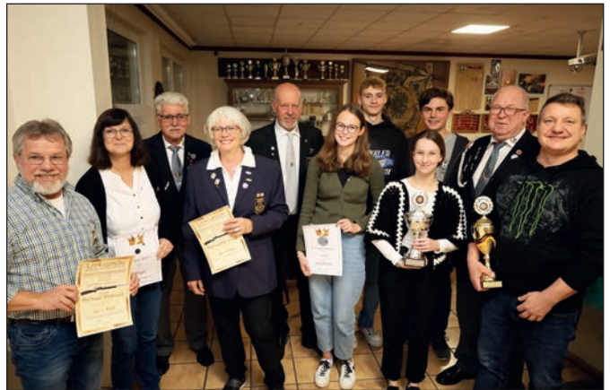
Die strahlenden Sieger.

tionell nutzen die Kyffhäuser die Herbstversammlung um ihre Vereinsmeister und Lan-