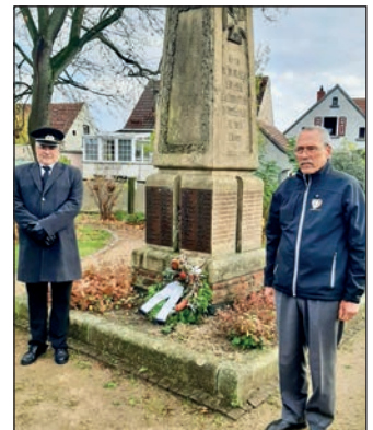
Vizepräsident des KB und Stellv. Landesvorsitzender KB Brandenburg am Ehrenmal in Ziesar.