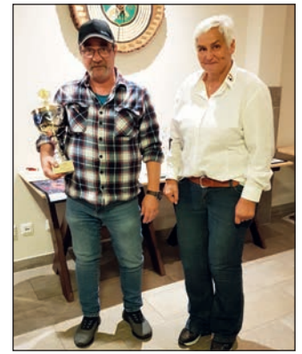
Übergabe des Wanderpokals.