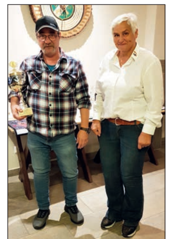
Übergabe des Wanderpokals.

ler durften sich ein Trostpreis aus den verschiedenen Sach- preisen aussuchen. Nach Mit-