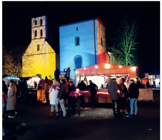
Die Besucher des Weihnachtsmarktes konnten das kuschelige Ambiente bei Glühwein, Kaffee, Waffeln und Kuchen genießen.

Während der Nachwuchs im Kinderkarussell seine Runden drehte, standen die Erwachsenen vor dem Problem, die Ergebnisse ihrer Shoppingtour oder die Tombola-Gewinne nach Hause zu transportieren. „Jetzt stehe ich hier mit meiner