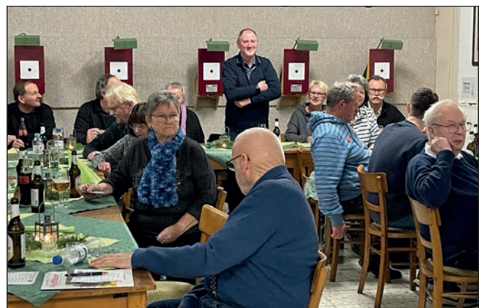
Gute Unterhaltung nach dem Essen.

wurde schadlos überstanden. Ein gelungener Kameradschaftsabend wurde gegen