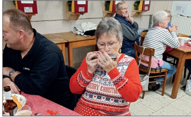
Begleitung mit weihnachtlicher Mundharmonikamusik.

Bereits im Vorfeld war der Vorsitzende der Kameradschaft nervös geworden, sagten doch in der Woche immer mehr Kameradinnen und Kameraden aus gesundheitlichen und anderen Gründen ihr Kommen ab! Er hatte bei verschiedenen Geschäften die Preise bestellt und konnte sie auch nicht mehr rückgängig machen. Das Gleiche galt für die bestellten Bockwürste. Über 650 Euro waren diesmal als Preise ausgelobt und bei 45 verkauften Karten und Halbzeitkarten, wäre alles im grünen Bereich gewesen! Trotz alledem war es ein gelun-