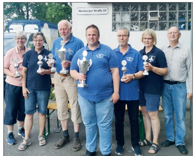
Die Sieger mit ihren Pokalen.