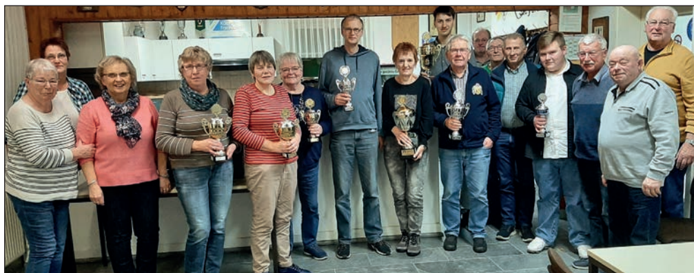
Sieger vom Abschlusschiessen in Steyerberg.

Am 24. November 2023 endete das diesjährige Schiessjahr der KK Steyerberg. Nach einem gemeinsamen Essen der 23 Teilnehmer/Innen fand das Er-