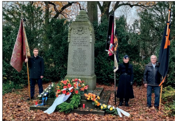
Kyffhäuserfahnen am Ehrenmal in Marienfelde.