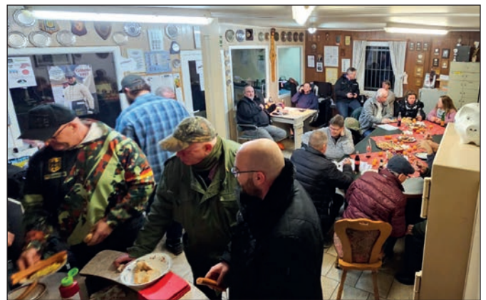
Die Teilnehmer am Nikolaustreffen.

Am Ende der Veranstaltung bedankte sich der Vorstandsvorsitzende im Namen des Vorstandes bei den Organisatorinnen, die wiederum an alles ge-