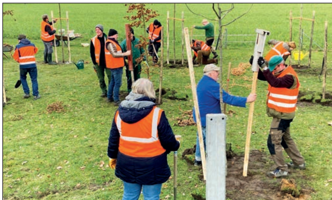
Die ersten Bäume werden gepflanzt.