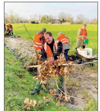
Gemeinsam geht's voran.

Damit konnten 12 Eichen und 15 weitere Bäume wie Wildkirsche, Marone Winterlinde, Blut- und Hainbuche, Feld- und Spitzahorn sowie Eberesche gekauft und eingepflanzt werden. Ein großer Dank gilt den tatkräftigen Mitgliedern und natürlich der Familie Rolf Wienke, die das Grundstück zur Verfügung stellt.