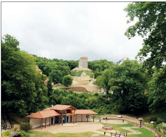
Solepark mit Hausmannsturm.