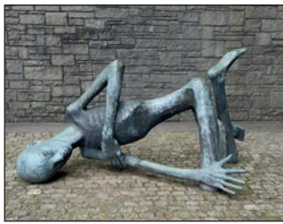
Die Skulptur „Der Sterbende Häftling“ in der KZ-Gedenk- stätte Neuengamme.

Wie alle Jahre wieder, eine kleine Feierstunde anlässlich des Volkstrauertages in den Ge- meinden, Roseburg und Güster. Die Bürgermeister der beiden Gemeinden zeigten sich ein wenig enttäuscht über die Be- teiligung zum Gedenken am Volkstrauertag! Die Kyffhäuser- Kameradschaft, die Freiwilligen Feuerwehren und das Bläser-