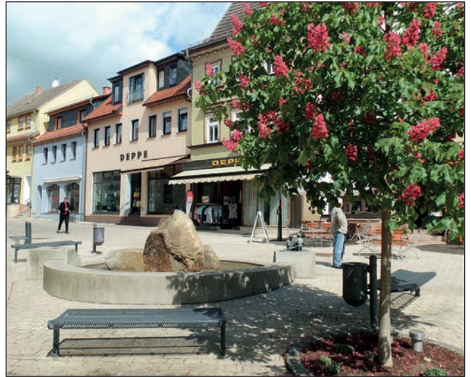
In der Erfurter Straße.

Hallo Freunde, jetzt zum Jahresbeginn machen viele Reisepläne für das Jahr. Warum nicht auch einmal zum Kyffhäuser. In Bad Frankenhausen gibt es viel kleine Hotels, Pensionen und Ferienwohnungen und preiswert sind sie auch. Von Bad Frankenhausen aus kann man viele Spaziergänge oder Ausflüge machen. Natürlich zum Kyffhäuserdenkmal, zu Barbarossa Höhle oder auch zum Fernsehturm. War er doch 1962 der erste Fernsehturm mit einem Café. Leider gibt es das heute nicht mehr, aber das Café am Fuße des Fernsehturmes ist sehr zu empfehlen mit seinen viel selbst gemachten Kuchen und Torten. Habe ich selber schon mehrmals ausprobieren können. Auch ein Ausflug zum Stausee nach Kelbra ist lohnenswert. Bis zum Sommer sind die Hochwasserschäden sicher beseitigt. Aber auch die Königspfalz in Tilleda ist einen Besuch wert. Ein paar Kilometer von Bad Frankenhausen befindet sich die Klosterruine vom Zisterzienser Kloster Göllingen welche auch besichtigt werden kann. In Bad Frankenhausen selbst gibt es viele Möglichkeiten zu Zeitvertreib. Sei es ein Bad im Sole Park mit seinem Solawasser. Nicht zu vergessen