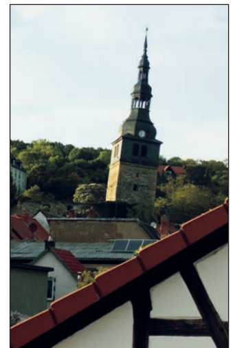
Der schiefe Turm.