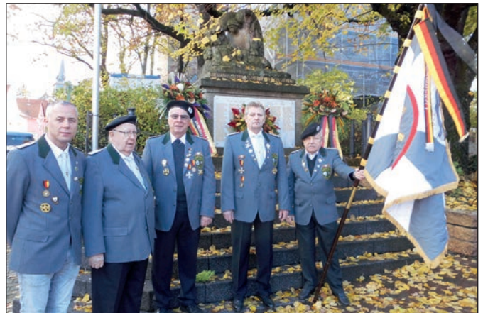
Die Teilnehmer vor dem Kriegerdenkmal.

Die Erinnerung an die vielen Toten der vorherigen Kriege und an die Soldaten der Bun-