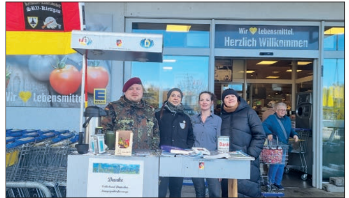
Der SRV Klettgau am Infostand.

Gräber zu pflegen sondern auch auf den Schlachtfeldern in gesamt Europa nach vermissten Soldaten der beiden Weltkriege zu suchen, zu identifizieren und dann diese in deren Heimat zu beerdigen. Es ist das Bestreben sich um die Aussöhnung und Verständigung der Völker zu bemühen was die Kriegsgräberfürsorge antreibt. Ferner sollen aber gerade die jungen Menschen, die in dieser nun fast 80 jähriger Friedenszeit hier in Deutschland aufwachsen dürfen daran zu erinnern was Krieg bedeutet und so ist die Kriegsgräberfürsorge auch ein Projekt um die gemeinsam mit allen Völkern am Frieden zu arbeiten und