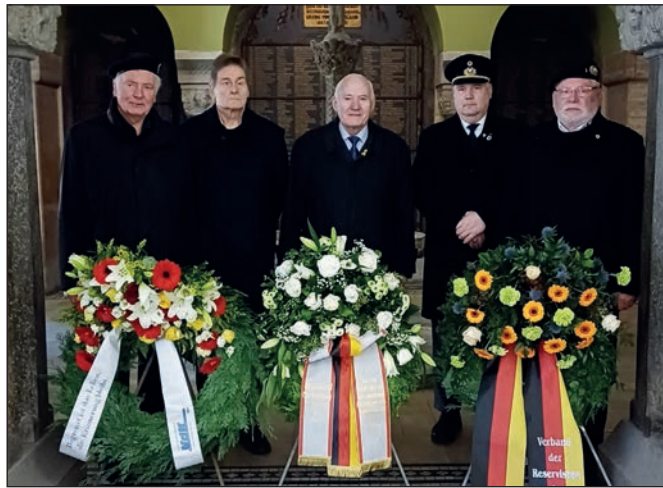
Die Kyffhäuserkameraden in der Ehrenhalle im Rathaus Charlottenburg.

Vom Bezirksamt Charlottenburg/Wilmsdorf nahmen die Vorsitzende der Bezirksverordnetenversammlung (BVV) Frau