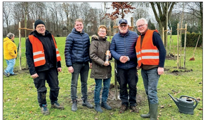
Dank an Familie Wienke.

ins Leben gerufen. Ein Kyffhäuserwald sollte entstehen. Nach langem Planen und Spendensammeln konnte nun auch ein Grundstück gefunden werden, so dass zum Arbeitseinsatz gerufen wurde. Insgesamt 52 Spender brachten 4000 € zusammen, das Land NRW steuerte 1000 € Förderung für Engagement und Nachhaltigkeit bei, aus der Vereinskasse wurden noch einmal 1500 € dazu gegeben.