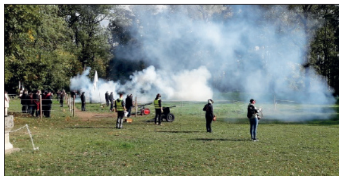
Salutkanonen im Schlossgarten.