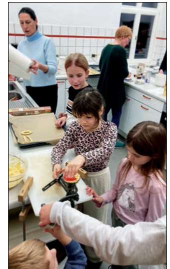
Probieren der Plätzchen.

Zum Abschluss der gemeinsamen Backaktion wurden in ge-