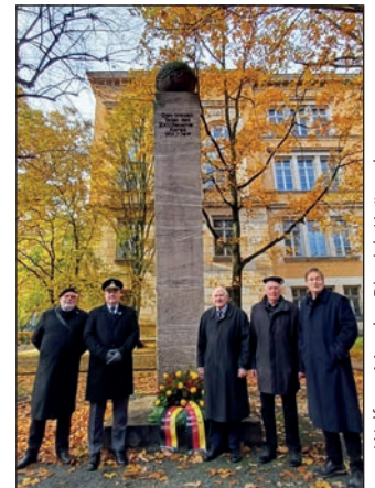
Die Kameraden der RK 04-Henning von Tresckow am Obelisk in der Bundesallee.

Veranstaltungen mit Lieddarbietungen. Im Anschluss sprach Pfarrer Karcz Gedenkworte. Ein Zapfenstreich und das Gemeinsame Singen des Deutschlandliedes beendeten dies würdige Veranstaltung.