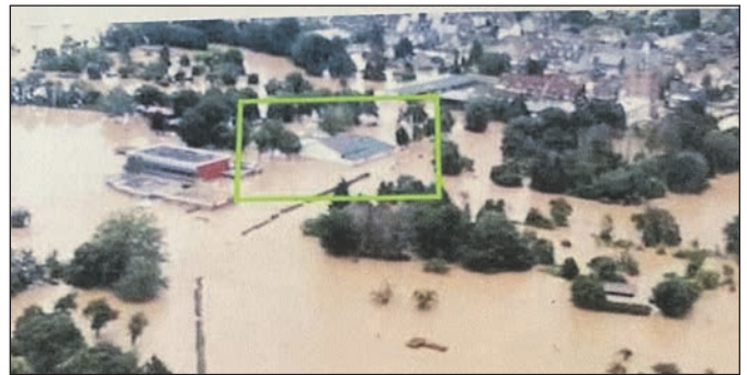
Mitten in der Flut.