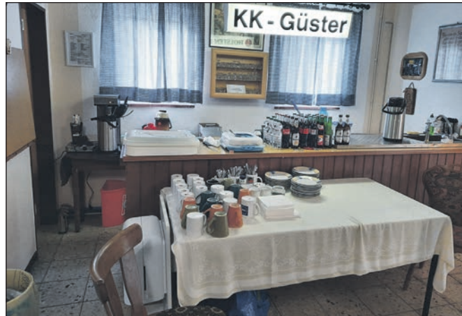
Es ist vorbereitet.

tige Meldungen zu den bevorstehenden Meisterschaften 2022. Wobei er auf die Besonderheiten bei der Mannschaftsauffüllung hinwies. Ob Corona bedingt die Meisterschaften stattfinden konnte er nicht mit Bestimmtheit sagen. Das Landspokalschießen und der Königsschuss wird gemäß Ausschreibung auf der Schießanlage der KK Güster geschossen werden. Das Qualifizierungsschießen zu den Meisterschaften wird in Güster oder auf den eigenen Schießständen geschossen und die Scheiben zur Auswertung an den stellvertretenden LSW zu übergeben sind. Der Vorsitzende der KK Güster informierte, dass der Schießstand der Kameradschaft durch den Schießstandsachverständigen für weiter vier Jahre freigegeben wurde. Zwei Auflagen sind der Behörde photographisch als erfüllt im Dezember zu melden. Er machte darauf aufmerksam, dass zurzeit viele Abfragen von verschiedenen Behörden erfolgen, ob das Mit-