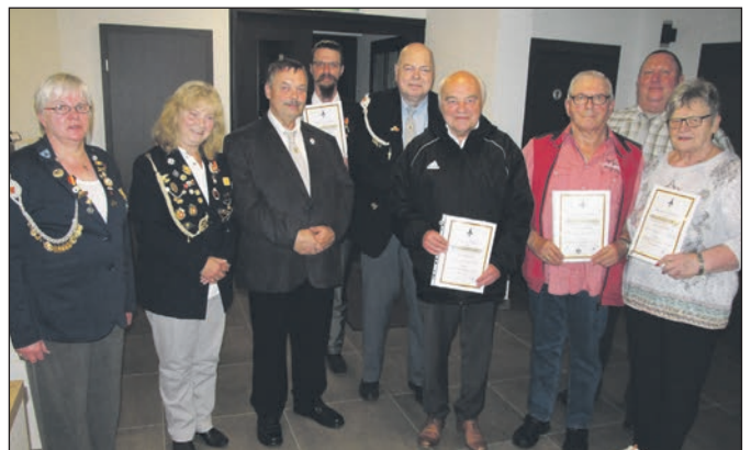
Die ausgezeichneten Teilnehmer.