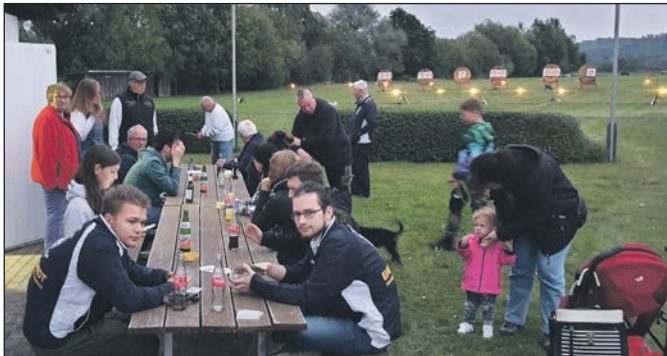
Nach dem Warmschießen, warten auf die Dunkelheit.

Es wurden 250 Euro an die Soforthilfe für Hochwasser geschädigte Vereine gespendet. Hilfe von Vereinen für Vereine - eine gute Sache.