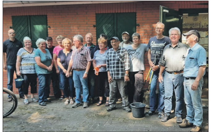
Reinigungseinsatz 2021 im Schützenhaus.

Nun haben die beteiligten Vereine Kyffhäuser Kameradschaft, Schützenverein und Kameradschaft Wellie am Samstag das Schützenhaus gereinigt, Fenster geputzt, Gardinen gewaschen, Außenanlagen gesäubert, Dach und Regenrinnen vom Laub befreit u.v.m. Der Schießbetrieb kann am kommenden Wochenende unter Einhaltung der Hygienevorschriften wieder beginnen. Auch als Wahllokal für die