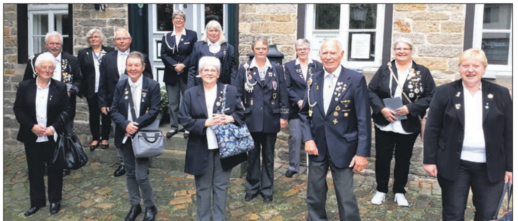
Die versammelten Teilnehmer der Arbeitstagung.

Geschäftsstelle des LV Gartenstraße 3c 38272 Burgdorf / OT Berel Tel. (0 53 47) 94 12 89 Fax (0 53 47) 94 14 41 E-Mail: info@kyffhaeuser-lv-shb.de www.kyffhaeuser-lv-shb.de