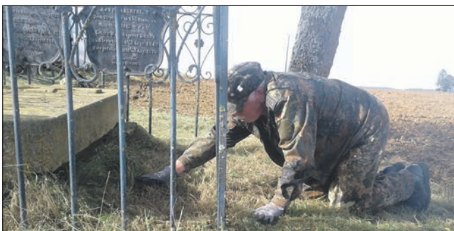
Die Teilnehmer bei der Arbeit an den Grabstellen...

sigen Bauhofes des VdK gestellt. Dieser Bauhof betreut ganzjährig mit ca. 14 angestellten Gärtnern etwa 180 Grabstellen im Nordosten Frankreichs. In ganz Frankreich gibt es sechs dieser Bauhöfe in verschiedenen Regionen. Zu den örtlichen Festangestellten kommen jedes Jahr viele Trupps verschiedenster deutscher Organisationen, die zum großen Teil ehrenamtlich ihre Dienste zur Verfügung stellen. Wie in diesem Fall die Klettgauer Reservisten. Untergebracht war man in einer Kaserne der Französischen Armee mitten in Metz. Dort war die Betreuung durch das zuge-