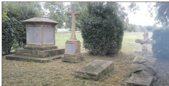
Grabstelle vor Arbeitseinsatz (li. Bild) und nachher (re. Bild).

teilte Personal sehr zuvorkommend. Für das Wochenende organisierte das französische Militär u.a. für die deutschen Besucher einen exklusiven Empfang beim Militärgouverneur Grand-Est, General D'Andoque und beim Kommandierenden General für Nord-Ost Frankreich, General Culot, in deren gemeinsamen Amtssitz, der ehemaligen Kaiserresidenz des Deutschen Kaisers Wilhelm II. Während einer sehr interessanten Führung durch die