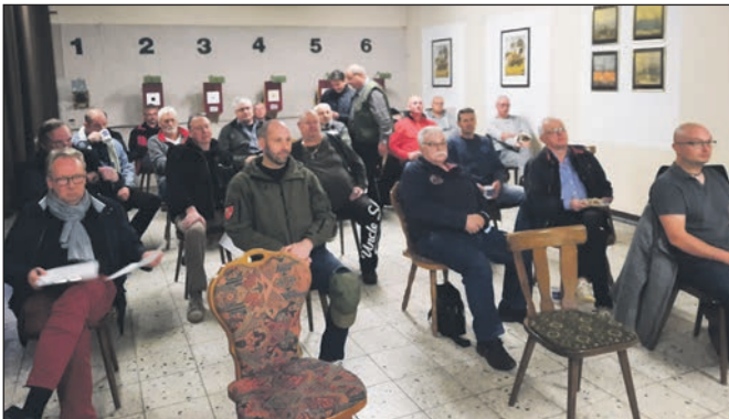
Die Teilnehmer der Tagung.

Spruch: „Einer für alle und alle für einen“, untermauert!