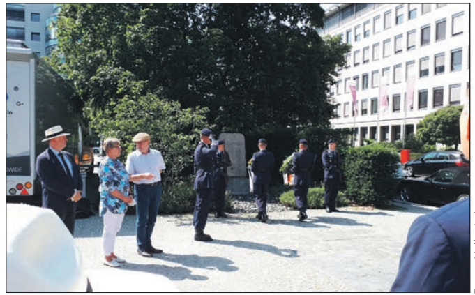
Marsch zur Kranzniederlegung.

ter Naumann fanden sich Berlinerinnen und Berliner ein, um der Toten zu gedenken, die bei dem Versuch ums Leben kamen, als sie in den freien Teil der Stadt flüchten wollten. „Ihrer zu gedenken und das Ereignis nicht in Vergessenheit geraten zu lassen, ist unsere Aufgabe, die wir den künftigen