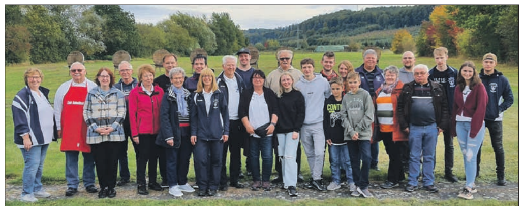
Die Teilnehmer des Boßeltturniers.

Am Sonntag, dem 3. Oktober 2021 hat sich die Kyffhäuser Kameradschaft Wulften zum 1. Boßeltturnier getroffen. Gestartet wurde auf dem Bogenplatz, die Runde ging hoch zum Arboretum, am Wasserturm vorbei durch die Feldmark zurück zum Ausgangspunkt. Es starteten 6 Mannschaften mit 4-5 Teilnehmern, die Gruppen waren gut gemischt von 10 bis 75 Jahren was alles vertreten. Der Spaß kam nicht zu kurz, alle waren guter Laune und hatten Kampfeslust. Bei der Rückkehr wurden alle von einigen Vereinsmitgliedern empfangen, die sich um das leibliche Wohl kümmerten. Bei der Siegerehrung