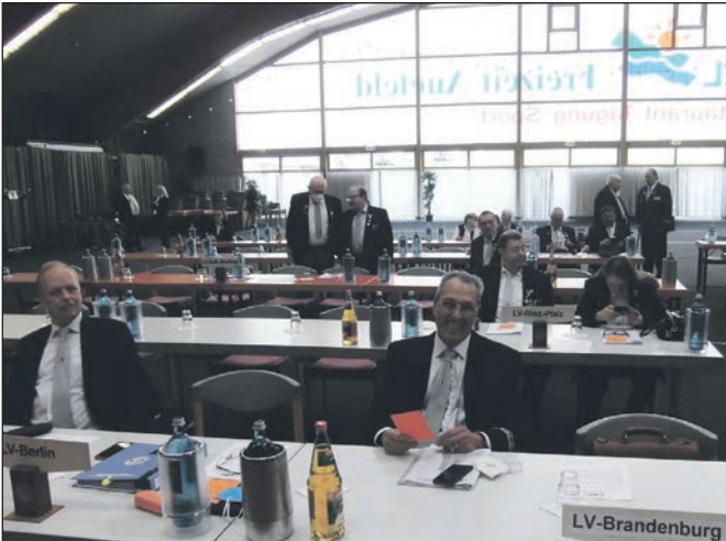
Blick in den Tagungsraum.