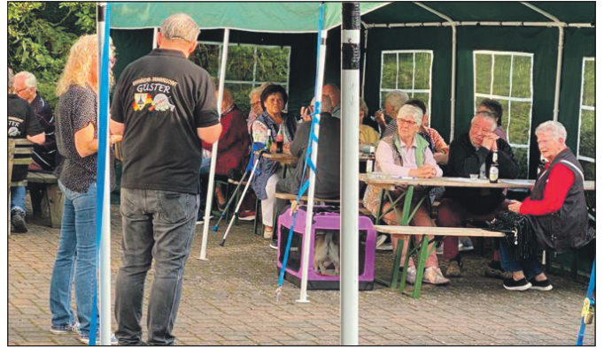
Stellv. und Schriftführerin eröffnen den Grillabend.

wurden in einer Teilnehmerliste erfasst! Man hatte auch die Möglichkeit, sich mit der Luca App einzuloggen. Die geforderten 3 G's wurden von