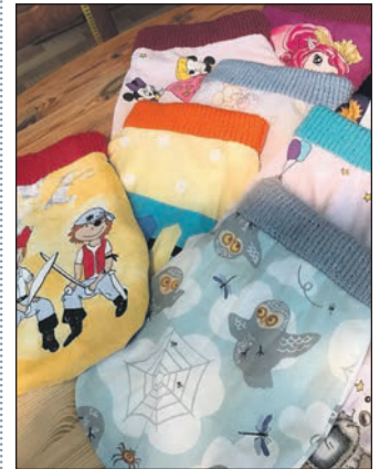
Die fertigen Pucksäckchen.