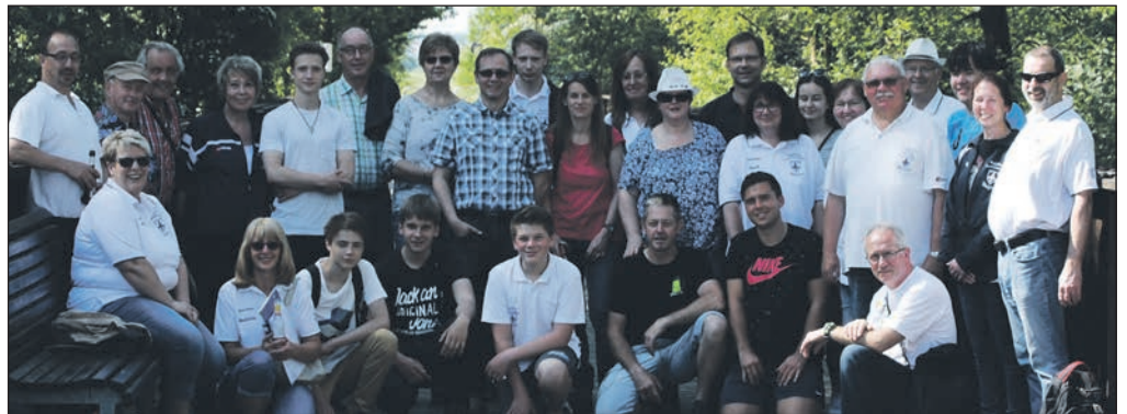
Die Teilnehmer des Wandertages.

Gerade die vielen Gespräche zwischen den einzelnen Spaten und Altersgruppen, habe schon einige interessante Vorschläge zutage gebracht, die dann auch umgesetzt worden