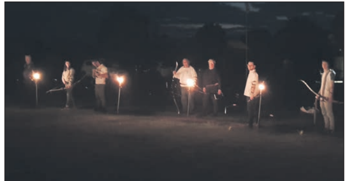
Der Startschuss ist gefallen und der Wettkampf beginnt.