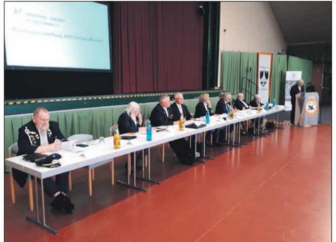
Das Präsidium während der Tagung.