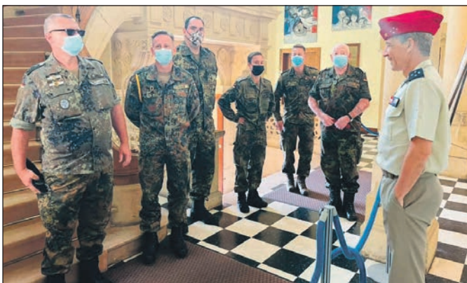
Die Deutschen werden vom Militärgouverneur General D'Andoque begrüßt.