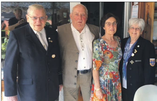
Glückwünsche zur Diamant Hochzeit.

sind. Auf halber Strecke gab es eine Vesper und am Ziel wurde dann mit gegrillten Köstlichkeiten der Gaumen verwöhnt.