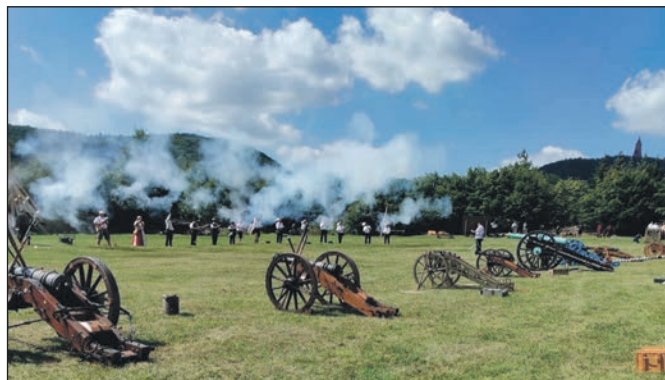
Böller mit dem Gewehr.