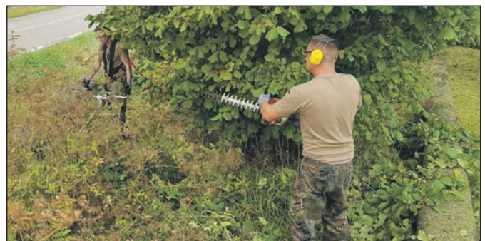
... und im Gebüsch.