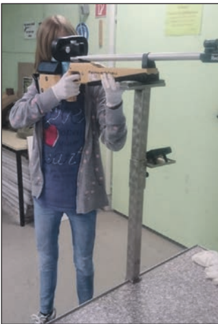
Das neue Lichtpunktgewehr im Einsatz.