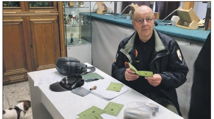
Der LSW bei der Verlängerung von Schießausweisen.

Es wird am 6. 07. und 13. 11. 2021 auf dem Schießstand der KK Güster eine Sachkundeprüfung angeboten. Die Ausschreibung kommt in den Aushang. Details können beim Leiter der Ausbildung erfragt werden. Bernd Trawinsky 04542 9854182.