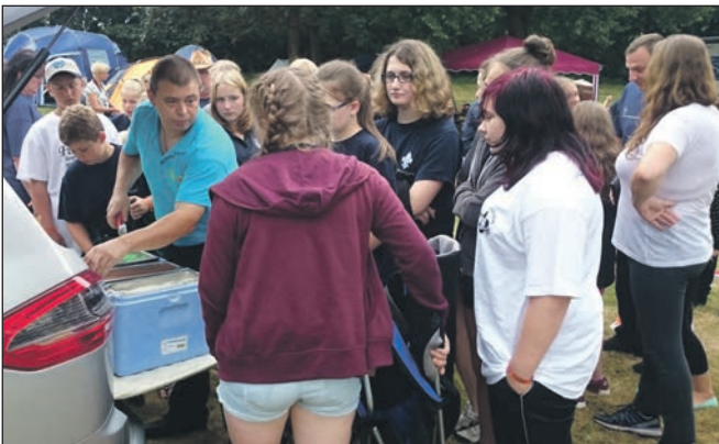
Andrang beim Eisverteilen.