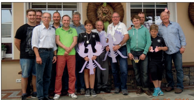
Die erfolgreichen Schützen.