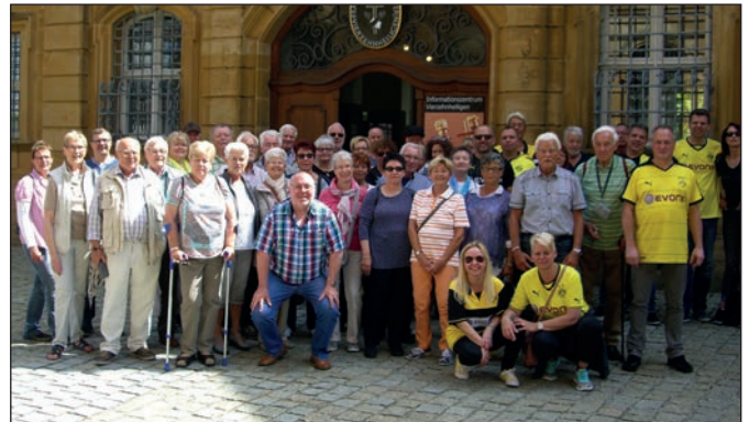
Eine zufriedene KK Dortmund-Asseln.

Der Jahresausflug der Kyffhäuserkameradschaft Dortmund-Asseln ging am 20. Mai für drei Tage in das main-fränkische Land nach Bamberg. Hier konnte nach Ankunft am ersten Tag die schöne Altstadt von Bamberg erkundet werden. Zahlreiche Gasthöfe luden bei herrlichem Wetter zum Verweilen ein. Am folgenden Tag wurde das kleine Städtchen Bad Staffelstein besucht. Nach einem etwas anstrengenden Fußmarsch erreichte man dort die sehenswerte Basilika der 14 Heiligen. Am Abend verfolgte man natürlich (teilweise in BVB-Shirts) das Pokalspiel BVB-Bayern München. Leider hatte der Besuch bei den 14 Heiligen nicht viel geholfen. Am letzten Tag auf der Rückfahrt führte uns die Reise in die Altstadt von Fulda. Nach einer kleinen Exkursion und anschließendem Mittagessen ging es wieder zurück in die verregnete Heimat.