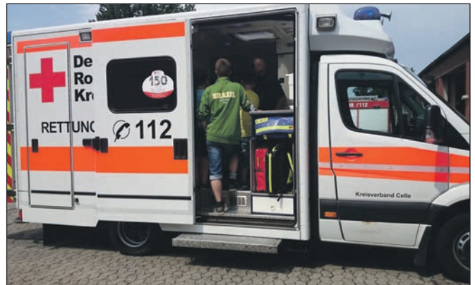
Besuch des Rettungszentrums.