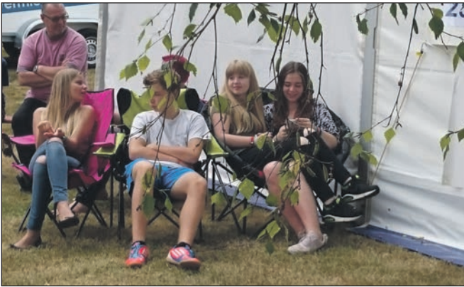
Zusammensitzen und sich austauschen.