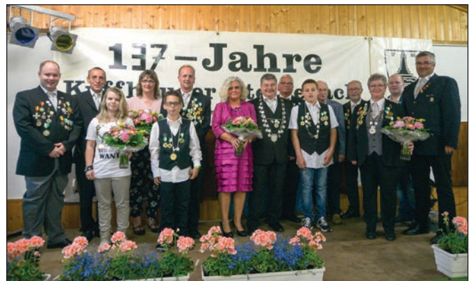
Die Geehrten beim Schützenfest.

war uns nun Anlass dies zu unternehmen. Am 17.6. 2016 machte sich eine Abordnung der KK Selztal auf zur Jubiläumsfeier am Kyffhäuserdenkmal. Es wurde eine sehr schöne und interessante Reise. Zwi-