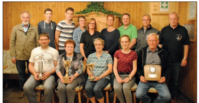
Die erfolgreichen Teilnehmer.

In Gorspen-Vahlsen fanden im Schützenhaus am Knickberg das traditionelle Dorfpokalschießen und die Wettbewerbe um den „König der Könige“ statt. In diesem Jahr gingen insgesamt 8 Mannschaften mit 48 Teilnehmern um den begehrten Pokal an den Start. Bei den Männern ergatterte sich mit 139 Ring das Team der Feuerwehr den ersten Platz, gefolgt vom Team der Laienspielschar mit 136 Ring. Nachfolgend setzten sich zwei Teams punktgleich auf den 3. Platz, sowohl der Verein der Gartenfreunde als auch der VfB Altherren erzielten 132 Ring.