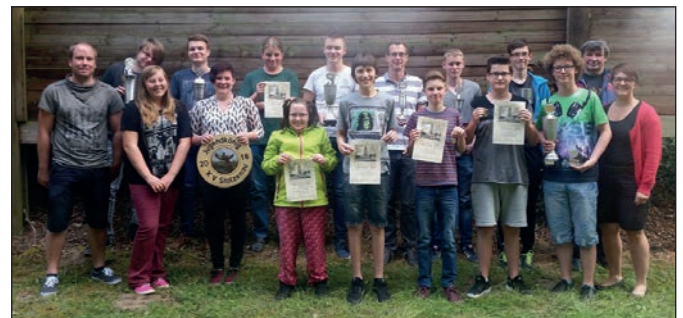
Die Teilnehmer und die Jugendwarte des Kreisjugendschießens.