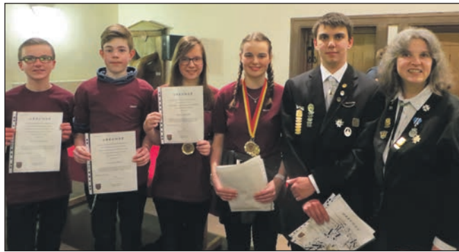
Die geehrten Schützinnen und Schützen.