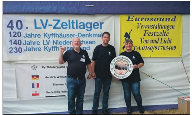
Die Ehrenschiebe wird präsentiert.