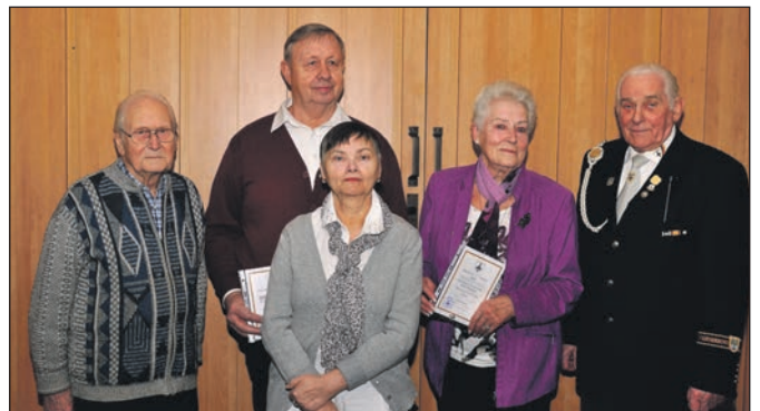
Jubilare und geehrte Mitglieder der KK Achim.