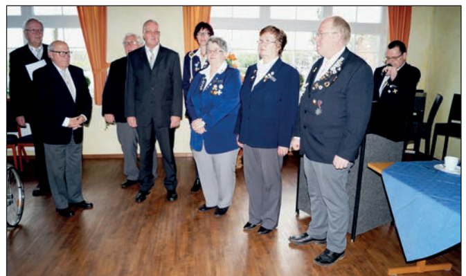
Die (wieder bzw. neu) gewählten Mitglieder des Präsidiums des OKB werden vereidigt.