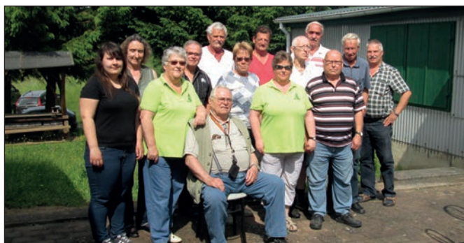
Gruppenfoto der Teilnehmer.

Spruch auf den Weg Glück ist der Freunde Sommer Sprichwort