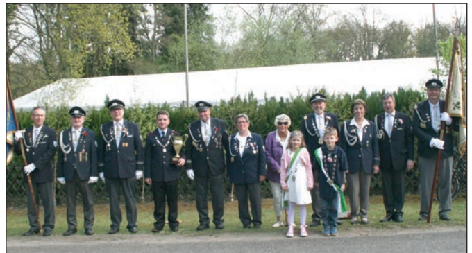
Es war ein gelungenes Fest: Die Königsfamilie der KK Veerßen, aufgestellt zum Erinnerungsfoto.

Das 51. Veerßer Bürger- und Schützenfest begann traditionell mit dem Königsschießen und dem sich anschließenden Ball mit Pokalverteilung. Vor der Eröffnung durch den 1. Vor-