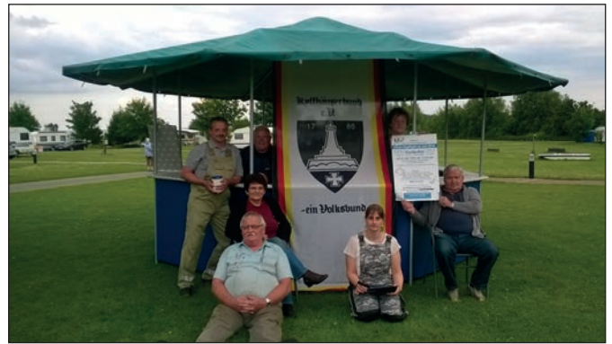
Pavillon mit Zapfanlage und Lava-Grill.

dass die Arbeiten bei schönstem Sonnenschein ausgeführt werden konnten und der Pavillon jetzt im neuen Glanz erstrahlt. Der Vorstand bedankt sich bei allen Kameradinnen und Kameraden für die großzügigen Spenden, wodurch die Restaurierung ohne weitere Vereinsgelder erfolgen konnte. Seinen ersten Auftritt bei den Kyffhäusern hatte das Glanzstück am Samstag auf dem Campingplatz „Seepark Sütel“, wo die Kameradschaft in rustikaler Atmosphäre ein Fischbuffet ausrichtete, das großen Anklang fand. Das reichhaltige Fischangebot wurde mit großer Begeisterung angenommen