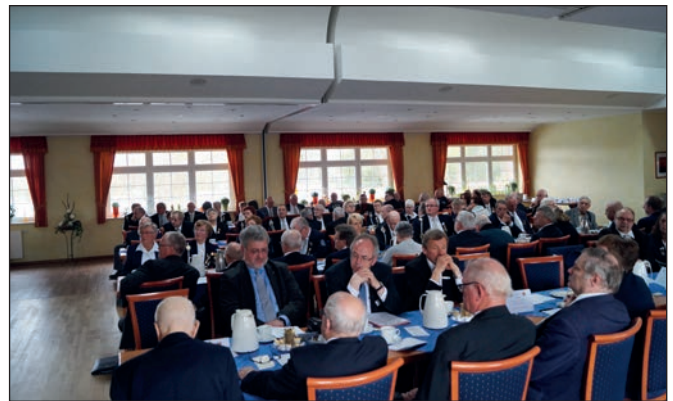
Bei der OKB Delegiertentagung waren alle Kameradschaften und Funktionsträger vertreten.