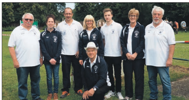
Die Teilnehmer aus der Kameradschaft Wulfthen nach dem Wettkampf mit den Recurve – Bogen in Heere.

An 3 Orten im Landesverband wurde die LMS durchgeführt. Ordonnanzwaffen konnte bei der Kameradschaft Breitenberg / KV Duderstatt geschossen werden. Das Bogenschießen fand im KV Wolfenbüttel-Salzgitter statt, bereits seit Jahren auf den Bogenstand der Kameradschaft Heere. In diesem Jahr hatte der Wettergott auf die Bogenschützen keine Rücksicht genommen, so fanden am ersten Tag die Wettkämpfe bei Regenschauern statt. Es war für Bogenschützen mal wieder ein Wettkampf unter schwierigen Bedingungen, Regen und star-