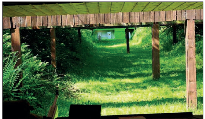
Blick auf die Schießbahn.