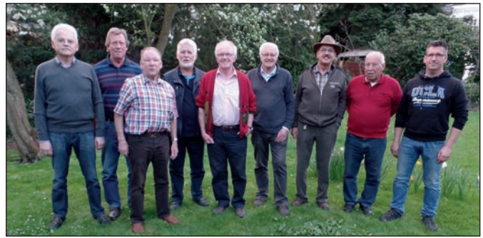
Ein Dankeschön an die Zusteller der Kyffhäuser-Zeitung.

im Festzelt an der alten Dorfschule. Das Lied „Die immer lacht“ bringt die Menge zum Beben. Die Jugendlichen singen mit, feiern ausgelassen und friedlich. Und das ist auch