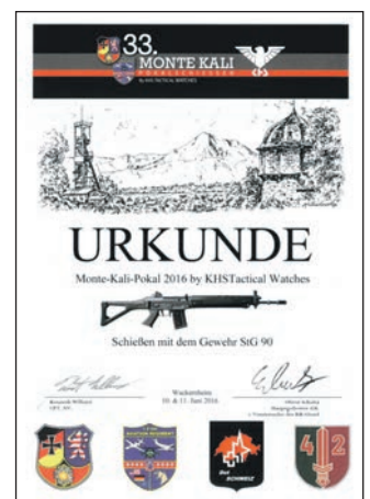
Mannschaftsurkunde MKP 2016.

Alles in Allem, war die MKP-Teilnahme wieder ein beeindruckendes Erlebnis, wo sonst finden sich Soldaten (aktiv/Res), Polizisten etc. aus über fünfzehn verschiedenen Nationen friedlich zusammen, um im fairen Wettstreit, mit der Waffe, ihre Leistungsfähigkeit unter Beweis