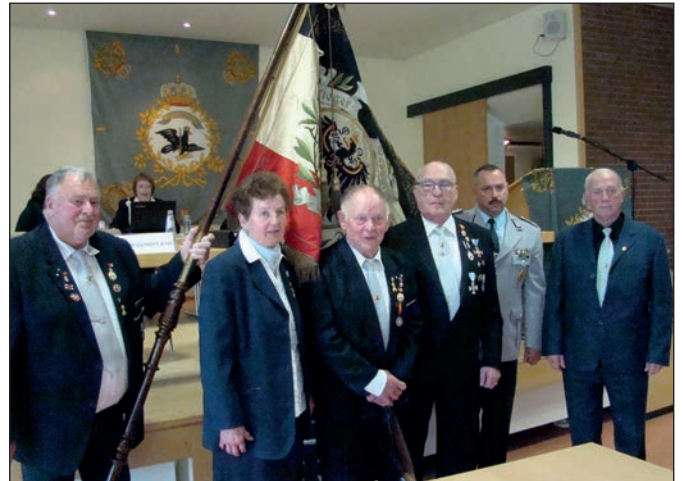
Übergabe der über 115 Jahre alten Originalfahne an die KK Sannerz.