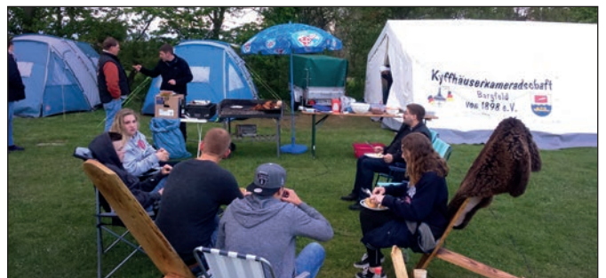
Die Kyffhäuser Jugend beim gemeinsamen Essen.

Es war wieder eine Runde Sache, wir freuen uns riesig auf das nächste Jahr und darauf das wir immer wieder mit neuen Jugendlichen der Kameradschaft dies schönen Tage genießen dürfen.