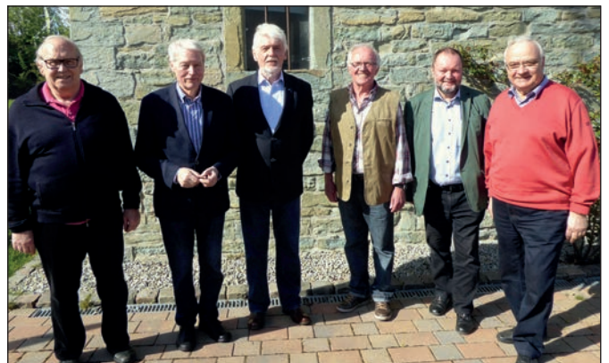
Die Teilnehmer der Ausstellung „Westfälische Salzwelten“.

der professionellen Aufbereitung einer Vielzahl wissenschaftlicher und teilweise auch überraschender Informationen rund um das Thema „Salz“. Nach einhelliger Meinung macht ein Besuch der interaktiven Ausstellung „Westfälische Salzwelten“ in Bad Sassendorf nicht nur Spaß, sondern vermittelt darüber hinaus auch viele neue Erkenntnisse über einen Stoff, den wir als Nahrungsmittel täglich zu uns nehmen und deshalb eigentlich schon zu kennen glauben.