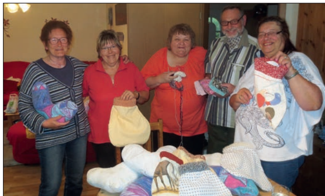
Das Team „Pucksäckchen“.

Das DRK-Krankenhaus besitzt eigene Pucksäckchen für die Säuglinge, die jedoch im Krankenhaus verbleiben müssen. Viele Mütter würden gerne die Pucksäckchen mit nach Hause nehmen. Damit das möglich wird, müssen mehr Pucksäckchen her. Nach einem Muster des Krankenhauses wurden im ersten Schritt 30 Pucksäckchen von den Frauenreferentinnen genäht. Bärbel Clasen hatte bereits diverse gespendete Kinderbettwäsche auf Lager. Mit