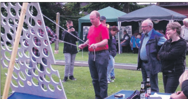
Die Teilnehmer des Frühlingsfestes.

Am 12.06.2016 fand das achte Frühlingsfest des Kyffhäuser-Kreisverbandes Aurich-Norden statt. Ausrichter war die Kyffhäuser-Kameradschaft Leezdorf. Trotz leichten Regens wurde dieses Fest ein voller Erfolg. Es wurde wieder einmal viel auf die Beine gestellt. Erstmals wurden zwei neue Spiele aufgestellt. So konnte man sein Können beim sog. „Leiterspiel“ oder auch beim „Himalaya-Spiel“ unter Beweis stellen. Es winkten tolle Sachpreise. Für das leibliche wurde ebenfalls reichlich gesorgt.