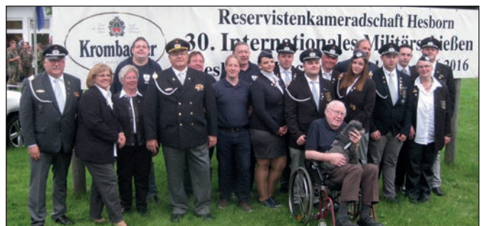
Die Teilnehmer des 30. Internationales Militärschießens.

als Sieger hervorging. In der Mannschaftswertung gab es folgende Ergebnisse: Jugend: Gorspen-Vahlsen 279 Ring, Damen: Hille 296 Ring und Herren: Hille 293 Ring.