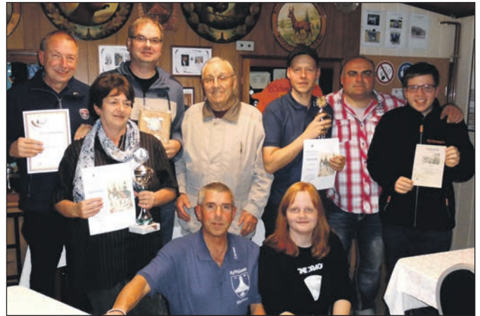
Die erfolgreichen Schützinnen und Schützen vom Pokal- und Vereinsmeisterschießen.