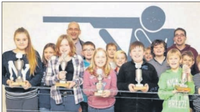
Glückliche Gesichter bei den Kindern.