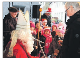
Der Weihnachtsmann hatte alle Hände voll zu tun...