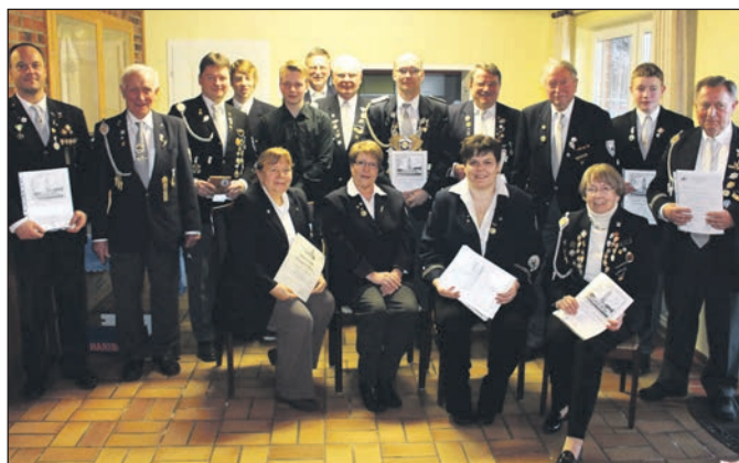
Erfolgreiche Teilnehmer an der Meisterschaft des Kyffhäuser-Landesverbandes Niederelbe in den verschiedenen Disziplinen sowohl mit der Mannschaft als auch der Plätze 1 bis 3.

unter: www.kyffhaeuser-altenmedingen.de zu finden.