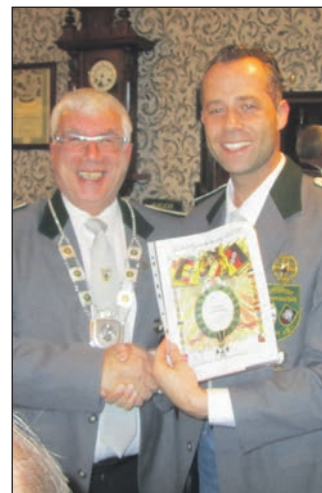
Übergabe an den neuen Schützenkönig.