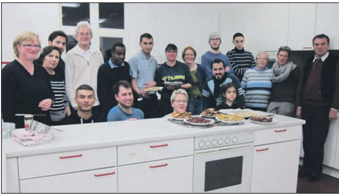
Gemeinsames Plätzchenbacken in der alten Dorfschule.