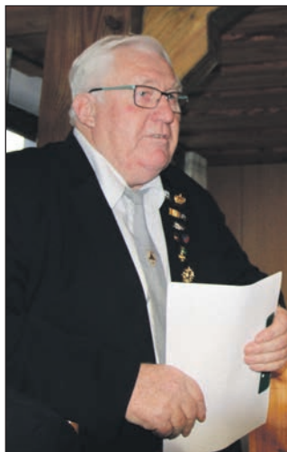
OKB-Schießwart und sein Team waren für die Siegerehrung beim Bundes- und Landesschießen verantwortlich.