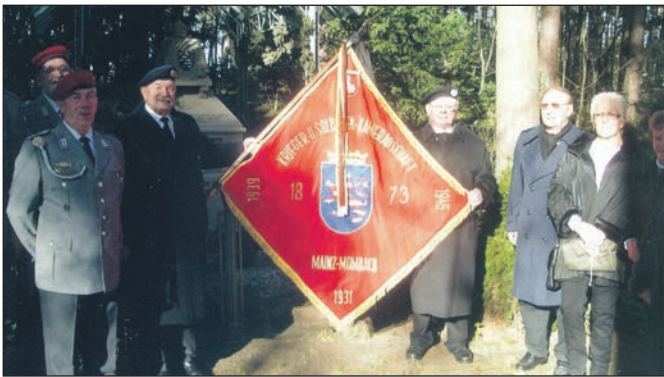
KK Soka 1873 Mombach mit Traditionsfahne.