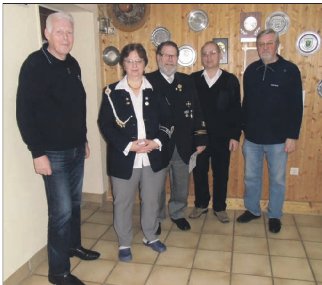
Die Mitglieder der KK Rothenburg bei der Jahreshauptversammlung.