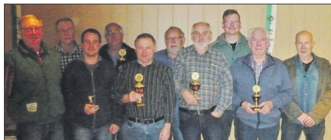
Bei der Siegerehrung.

Eine Mannschaft bestand aus drei oder mehr Schützen, die neun Schuss abgeben durften,