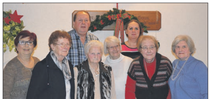
Die Frauengruppe der KK Meßlingen mit Ehrengästen.