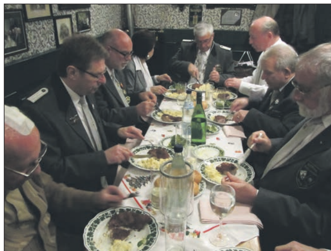
Leckeres Essen bei fröhlichem Beisammensein.

Ringe wurden freudig entgegen genommen. Alle anwesenden Mitglieder bekamen auch, wie in jedem Jahr, eine große Tüte mit Weihnachtsleckereien. Es war ein durchaus gelungener