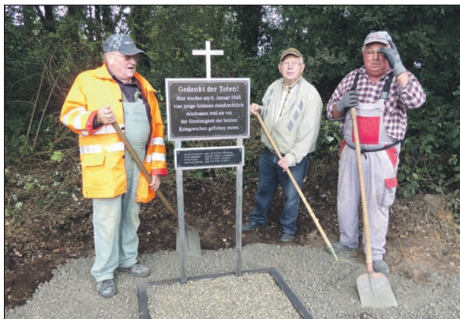
Die Gedenktafel wurde wieder aufgestellt.

fiel, wären Spuren verräterisch gewesen und so wechselten sie zu einem anderen Landwirt, der sie jedoch wenig später aus Angst vor möglichen Konsequenzen verriet. So wurden sie verhaftet, verurteilt und nach kärglicher seelsorglicher Betreuung erschossen. Die o.g. Gedenktafel war lange Zeit in Vergessenheit geraten und schließlich, am Rande eines kleinen Wäldchens von Unkraut und Gebüsch überwuchert. Am 25. Aug. 2015 schließlich nahmen einige Kameraden der KK Geldern-Veert sich der Gedenkstätte an und sorgten für ein neues Umfeld. Die Tafel wurde aus dem Erdrich gehoben, eine neue Freifläche ausgeschoben und die Tafel wieder in ein Betonfundament gestellt. Um die