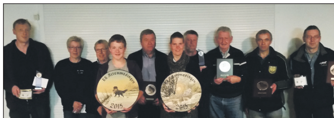
Stolz auf Auszeichnungen: Großer Beliebtheit bei den Schützen erfreut sich das Schießen auf Wildscheiben.

das bessere Ergebnis beim Liegendschießen auf den Fuchs. Die komplette Ergebnisliste ist