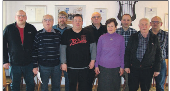
Die Mitglieder des Kyffhäuser-Kreisverbandes Franckenberg in Birkenbringhausen nach der Klausurtagung.

Gute Gespräche, fruchtbare Zusammenarbeit dazu haben sich die Mitglieder des Kyffhäuser-Kreisverbandes Franckenberg am Wochenende zu einer Klausurtagung in Birkenbringhausen (Gasthaus Bilsse) getroffen. Hier wurde der kommende Kreisdelegiertentag der am 12. März in Battenberg stattfindet ausführlich besprochen und einige Termine für das Jahr 2016 festgelegt. F. Nawrotzki