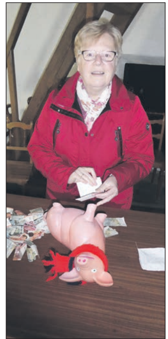
Das Sparschwein wurde „geschlachtet“.