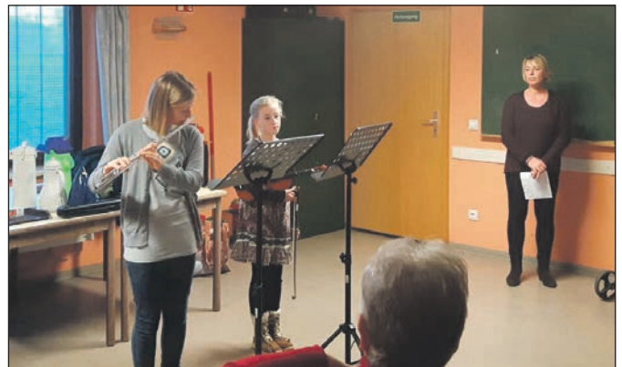
Die jungen Künstler während der Weihnachtsfeier.

Am Sonntag, 13. Dezember trafen sich fast alle Mitglieder mit ihren Partner zu einer besinnlichen, gelungenen Weihnachtsfeier. Gemeinsam wurden Weihnachtslieder gesungen, Geschichten vorgelesen und als Überraschung gab es ein musikalisches Potpourri von 2 jungen Musikantinnen aus dem Ort (im Alter von 8 und 12 Jahren) auf der Geige und Querflöte. Dieses war der krönende Abschluss einer gelungenen Weihnachtsfeier bei Kaffee, Zuckerkuchen und Torten. Es war die 3. Weihnachtsfeier der Kameradschaft, die zu einem festen Bestandteil geworden ist. Die Zufriedenheit drückte sich auch durch die großzügigen Spenden der Mitglieder zu der Feier aus, die dadurch komplett finanziert wurde.