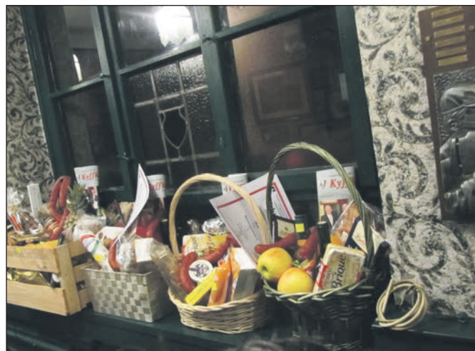
Die Präsentkörbe stehen bereit.

Dieter Moseberg, KK Trier Euren 1909 e.V.