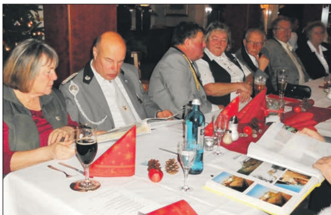
Großes Interesse herrschte bei der Sichtung der Fotoalben.