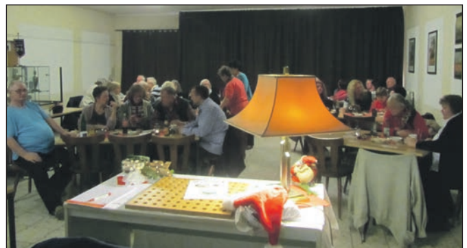
Der Lottoabend war wieder mal ein voller Erfolg.

100 Preise hatte er besorgt. Zur Ausspielung in jeder Runde kamen 1 Schweinenacken 3 Kg 1 Krustenbraten 2,2 Kg 1 Ente 1 Kasseler Nacken 2 Kg, 1 Mettwurst, 1 Kaffee, 1 Hähnchen, 1 Wein Auslese, 1 Schaumküsse (beliebt bei allen Teilnehmern) als letzter Preis in jeder Runde