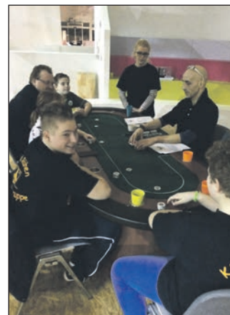
Jugend beim Spiel „Quartern“.