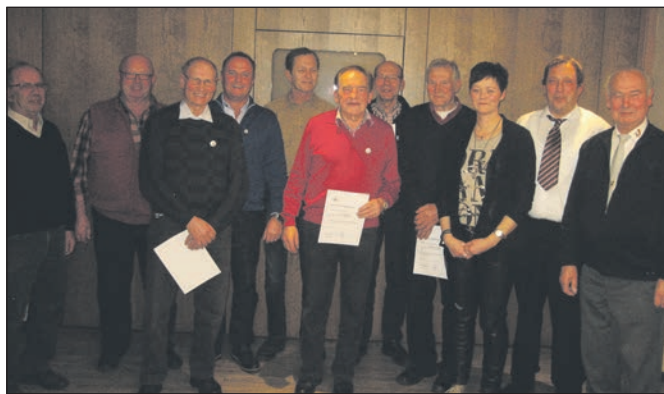
Ehrungen bei der Hauptversammlung der KK Grüningen.