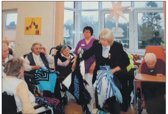
In einem Altenheim wurden zu Weihnachten Stolas verteilt, die von einer Kameradin gehäkelt und gespendet wurden.