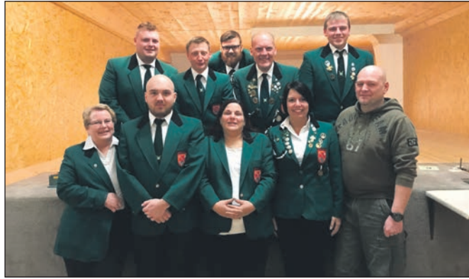
Teilnehmer der Jahreshauptversammlung 2016.