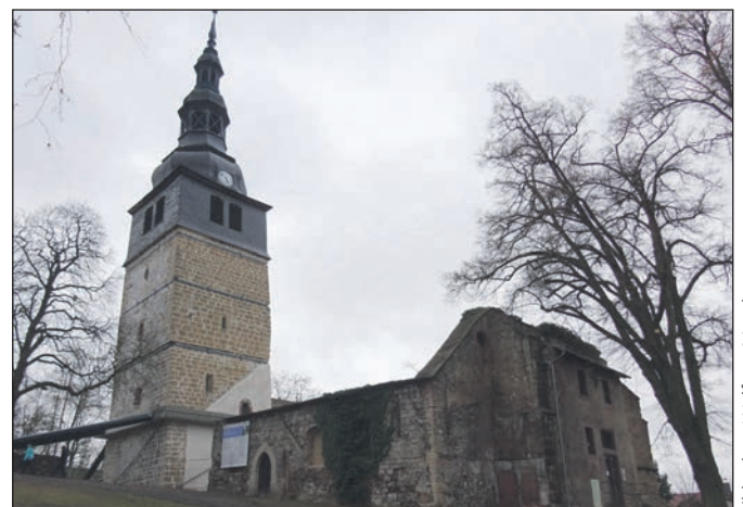
Blick auf den Turm von Westen und Druckrohre an Ost- und Nordseite.

höhle führte mich mein Weg auch zum schiefen Turm, oder bessergesagt, zur der als Ruine erhaltenen Kirche „Unser lieben Frauen am Berge“, auch Berg- oder Oberkirche genannt. Hier konnte ich mich dann von der Rettung des schiefen Turmes in beeindruckender Weise überzeugen. Ein sehr kompetenter Herr im Infopavillon gab mir umfassend Auskunft und ich erwarb ein Plakat, welches die Rettung plastisch darstellt. Auf dieses möchte ich mich hier auch auszugsweise beziehen. Gefördert wurde der 1.Bauabschnitt aus Mitteln aus dem Bundesprogramm „Nationale Projekte des