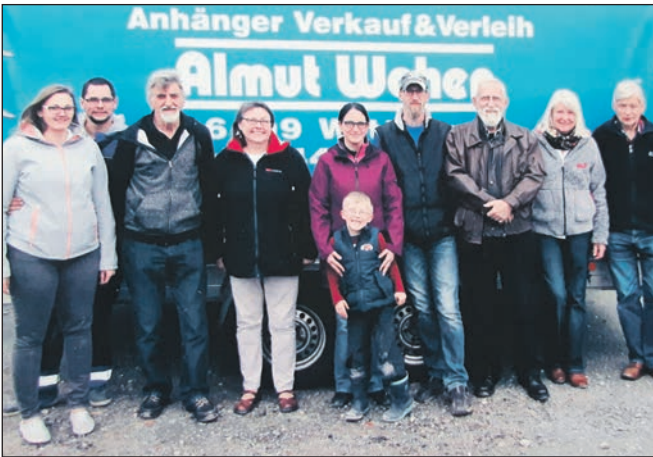
Ein großer Anhänger mit Hilfsgütern wurde für einen Transport nach Polen abgegeben.