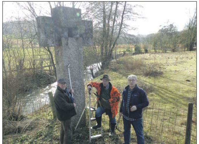
Nach Reinigung des Kreuzes.

dert. Zu ihrer Überraschung stellte sich das vier Meter große Kreuz nach der Entlaubung von