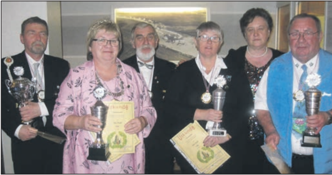
Vorsitzende mit Königsparen.