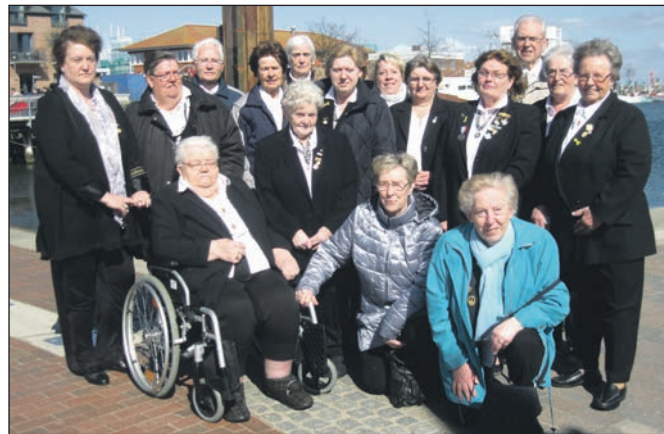
Gruppenbild am Hafen von Heiligenhafen.

Kyffhäuserbund e.V. Landesverband Schleswig-Holstein Postfach 2963 24028 Kiel Tel. (04 31) 56 78 55 E-Mail: kyffhaeuserbund.kiel@freenet.de www.kyffhaeuserbund-schleswig-holstein.de