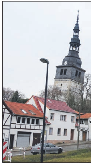
Ansicht des schiefen Turmes von Süden.