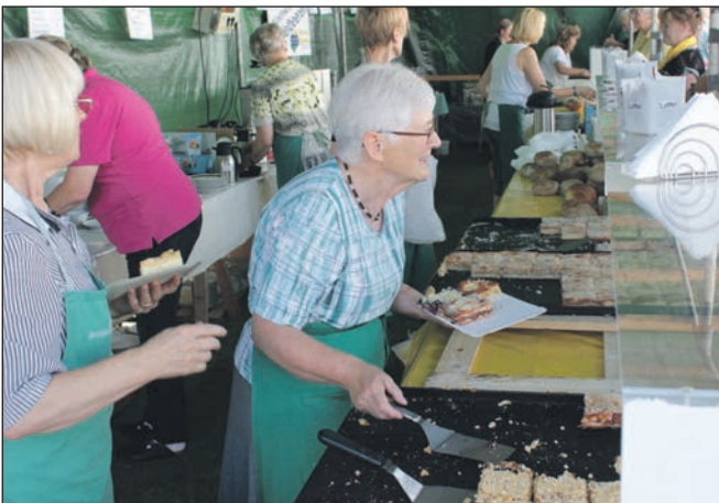
Soziales Engagement auch in der Öffentlichkeitsarbeit.