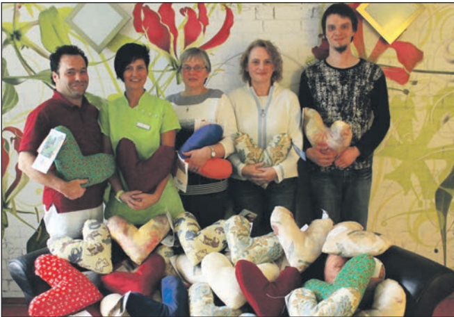
Herzkissen werden an Brustkrebspatientinnen verteilt.