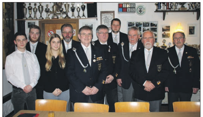
Die Teilnehmer und Ausgezeichneten.