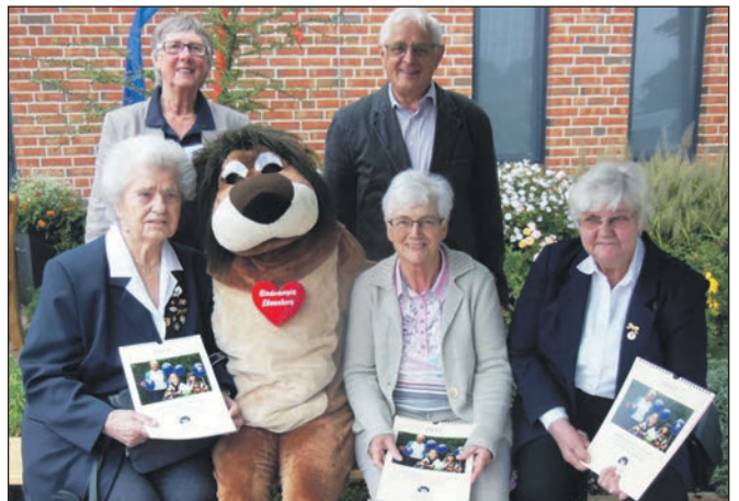
Hier wurde eine Geldspende an das Kinderhospiz Löwenherz gespendet.