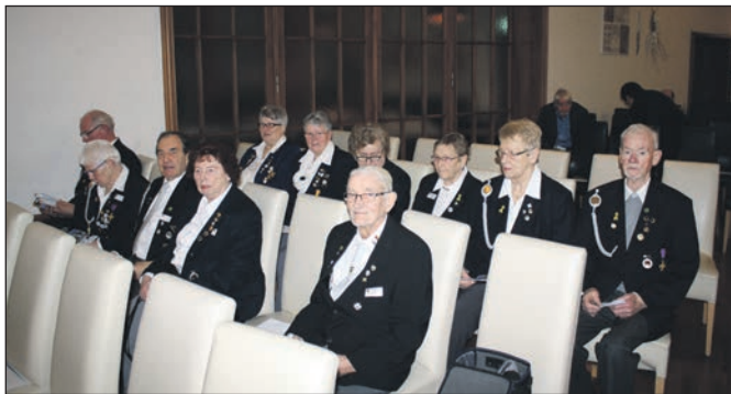
Beim Neujahrsempfang der Reservisten-Kreisgruppe Ahlhorn waren viele Kyffhäuser vertreten.