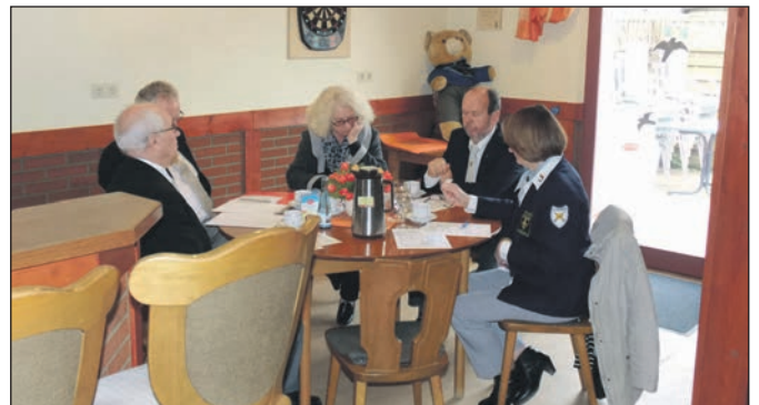
Die Marienfelder Kameraden beim Studium.