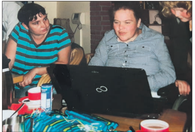
Diese Kameradin mit ihrer Tochter (re.) sitzt durch eine Hirnblutung im Rollstuhl und lebt in einem Pflegeheim. Ihr wurde ein Laptop zum 40. Geburtstag gespendet.