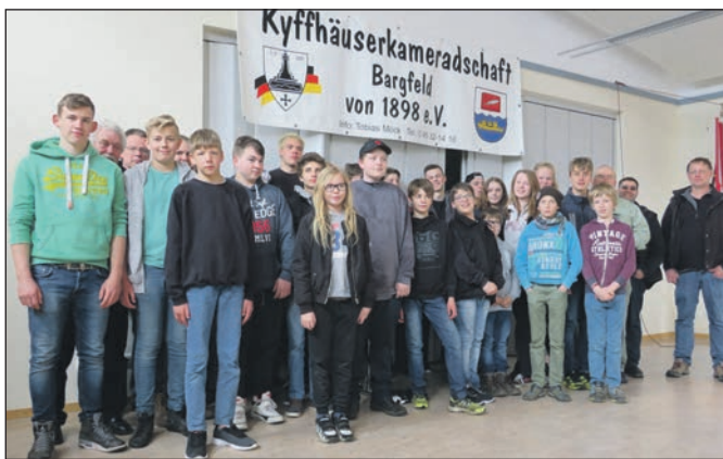
Die jugendlichen Teilnehmer bei der Jahreshauptversammlung.