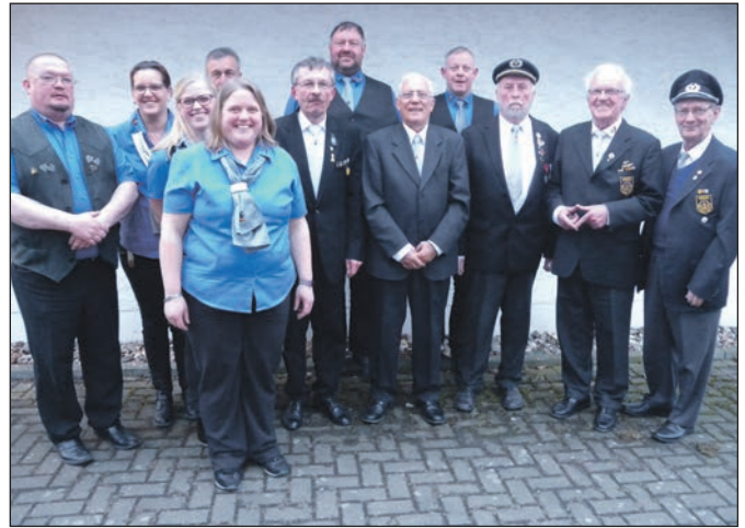
Gruppenbild der Teilnehmer der KV Soest.