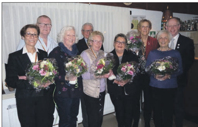
Die Siegerinnen und Sieger des Preisschießens.