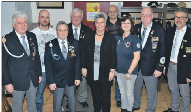
... bei der Jahreshauptversammlung.