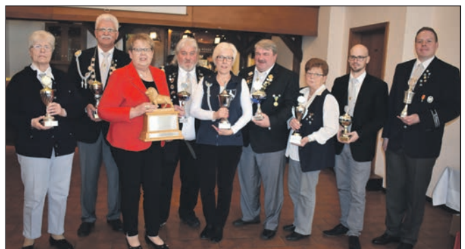
Die Pokalgewinner vom Winterabschluß in Woltorf.