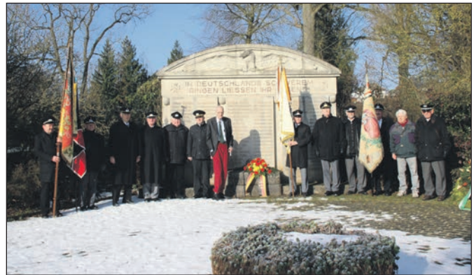
Fahnenabordnungen am Ehrenmal auf dem Friedhof in Mengerschinghausen.