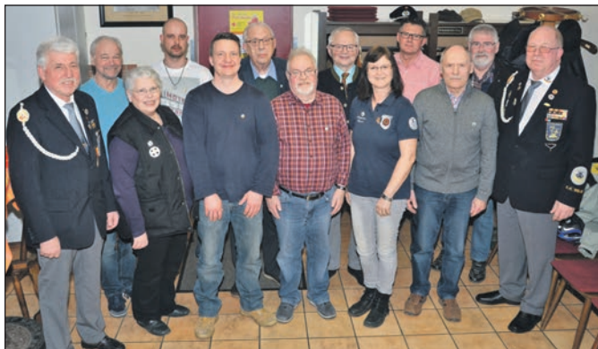
Die Mitglieder der Kyffhäuserkameradschaft Welver...