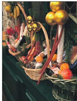
Liebevoll gestaltete Präsentkörbe für Platz 1-3.

einsheim, der im Altberliner Stil gestalteten Opernklausur, aus.