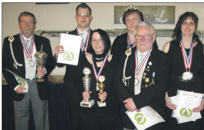
Die glücklichen Gewinner der KK Heiligenhafen.

Zu aller Erst nahmen alle ein gemeinsames Essen zu sich und im Anschluss daran konnte dann zum gemütlichen Teil übergegangen werden.