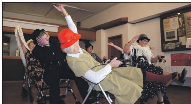
Das Rollator-Ballett im Einsatz.