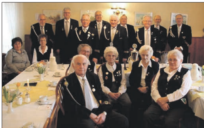
Delegierte des KV Achim zur JHV 2018.