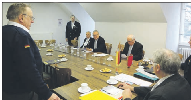
Vor der Versammlung.