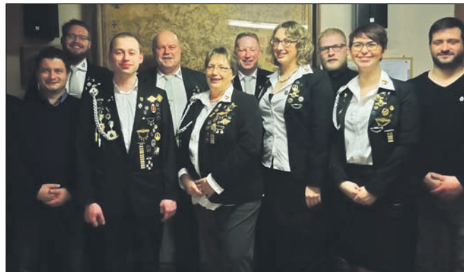
Der Vorstand der KK Bosserode.

Im Fokus der diesjährigen Jahreshauptversammlung standen die Neuwahlen des Gesamtvorstandes. Das Ergebnis der Wah-