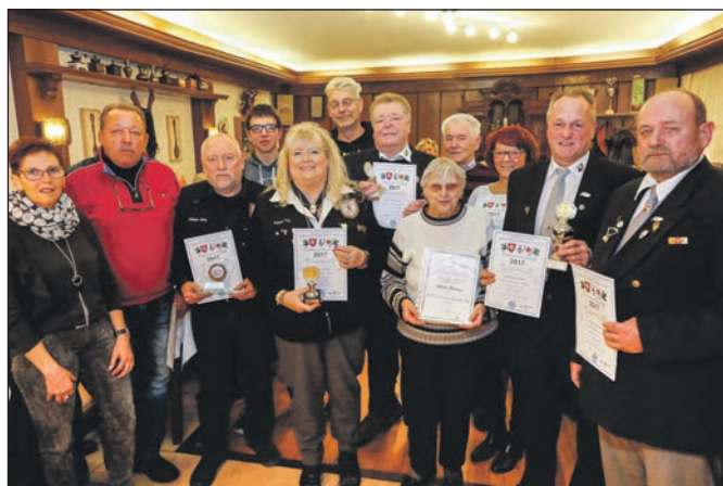
Die Geehrten der KK Dortmund-Asseln.